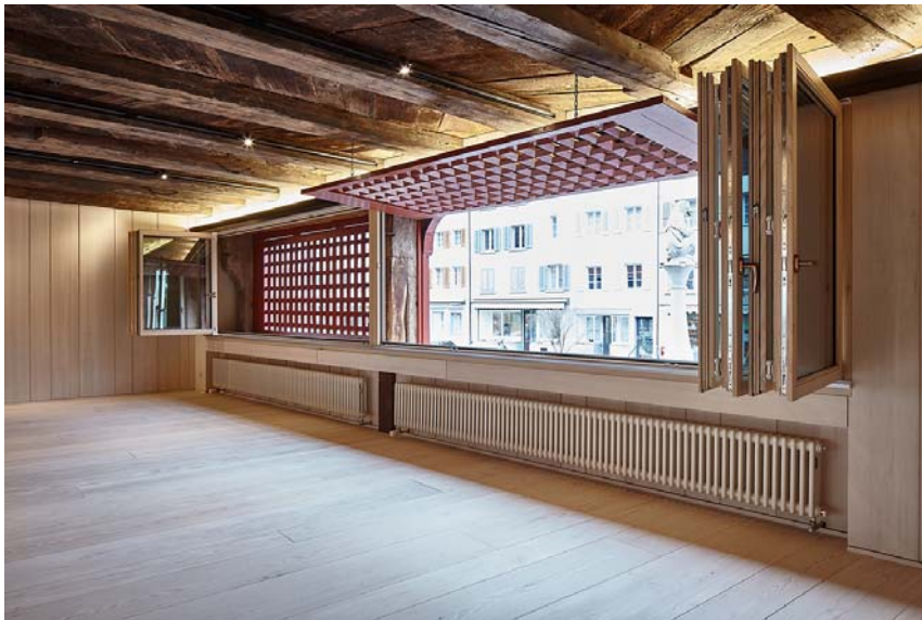
Das kürzlich umgebaute und sanierte Rathausmuseum in Sempach LU.