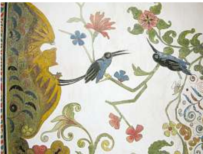
Der Erbauer der Villa Patumbah, Karl-Fürchtgott Zundel-Grob, liess sein Heim im Inneren mit indonesischen Motiven aufwendig ausschmücken. Die Wandmalereien und Schnitzereien erinnern an seine Zeit als Tabakplantagenbesitzer in Sumatra.