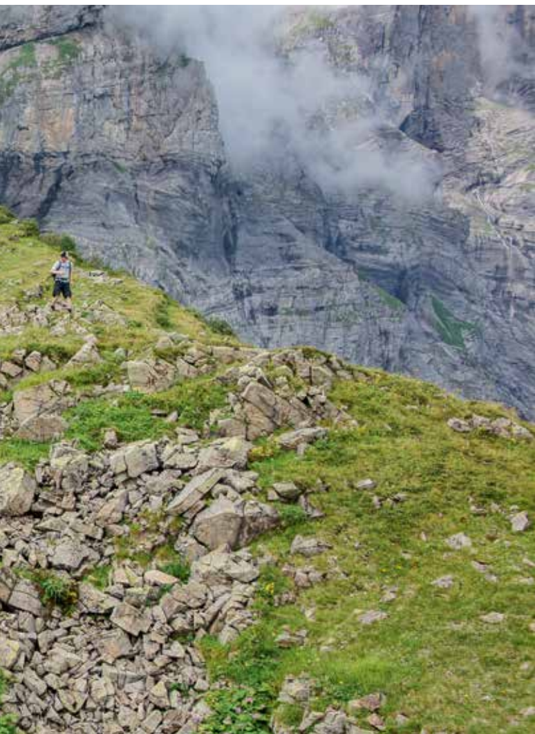
Einer von über 20 ehemaligen Alptrieben am Surenenpassweg. Die kleine Hütte auf Attinghausen-Geissrüggen (1954 m ü. M.) umfasste zwei Räume.

L'un des 20 anciens alpages recensés au col de Surenen. Cet alpage situé à Attinghausen-Geissrüggen (1954 m) comportait deux pièces.