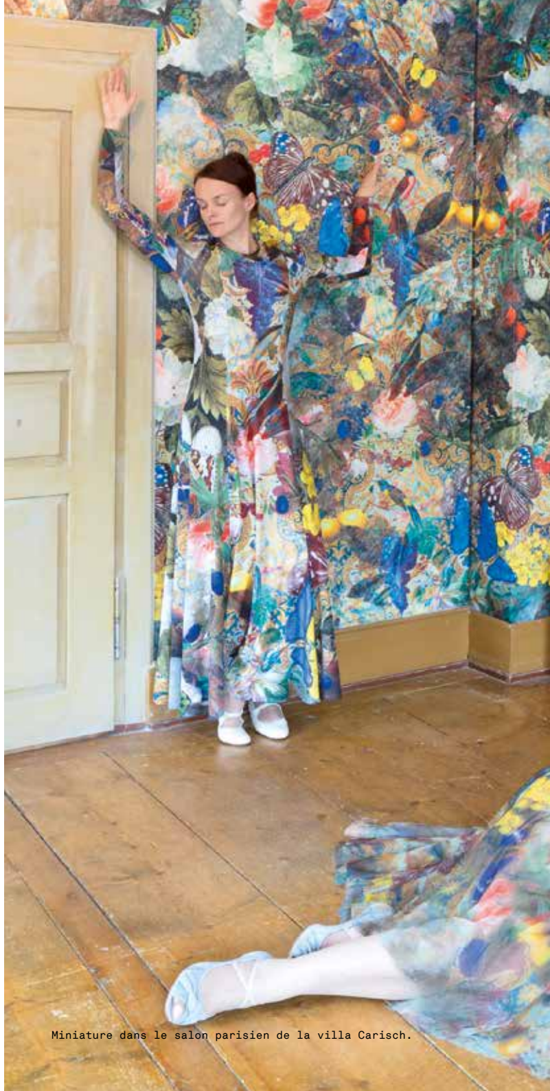
Miniature dans le salon parisien de la villa Carisch.

La décision d'utiliser la villa pour y aménager vestiaires, foyer et café, permet de préserver la grange-étable de Carisch – sans conteste la plus belle du village – d'un trop-plein qui lui aurait été fatal. Le bâtiment abritait jadis 40 bœufs, deux chevaux, beaucoup de foin et un important parc de véhicules. La suppression des éléments d'aménagement en bois pourris révéla les qualités spatiales de la grange. Il était hors de question d'y installer une boîte noire, car on entendait tirer parti de l'atmosphère singulière de l'espace et de la lumière naturelle qui s'y infiltrait pour les représentations, tout en rendant palpable la force élémentaire du gros œuvre. L'évidement du bâtiment produisit une salle sublime, d'un caractère quasi sacré. Pour des raisons acoustiques, les vitrages des baies en plein-cintre furent posés au nu extérieur des murs. Les grands panneaux de verre réfléchissent l'univers des montagnes et symbolisent ainsi le rôle du théâtre, qui reflète les événements du monde.