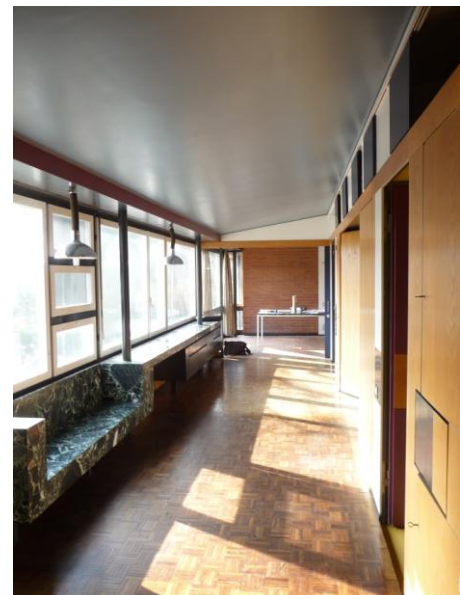
4 Korridor ("Spielhalle")