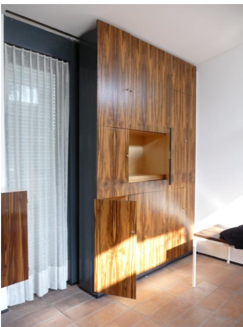
8 Schrank im Wohnzimmer