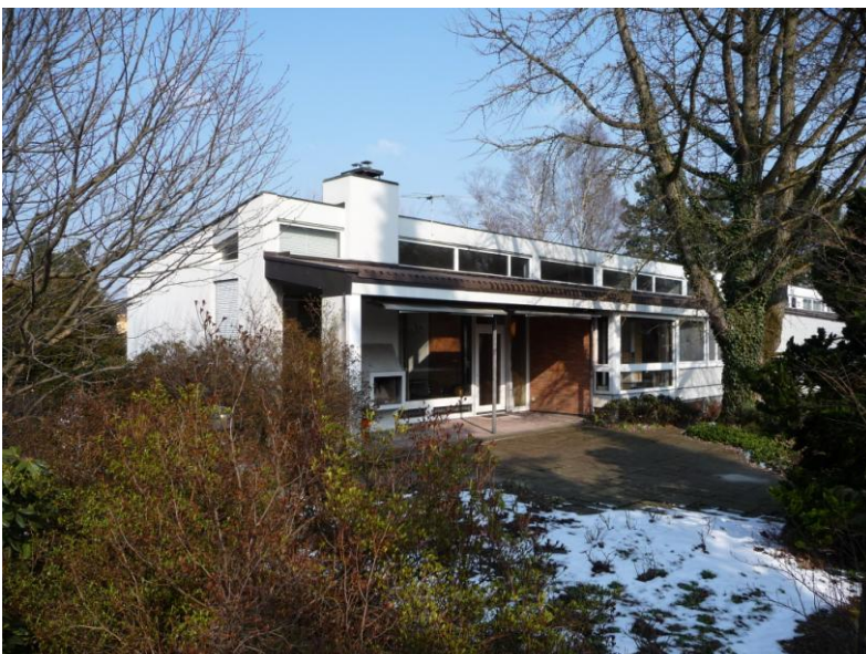
3 Ansicht von Südwesten, heutiger Zustand